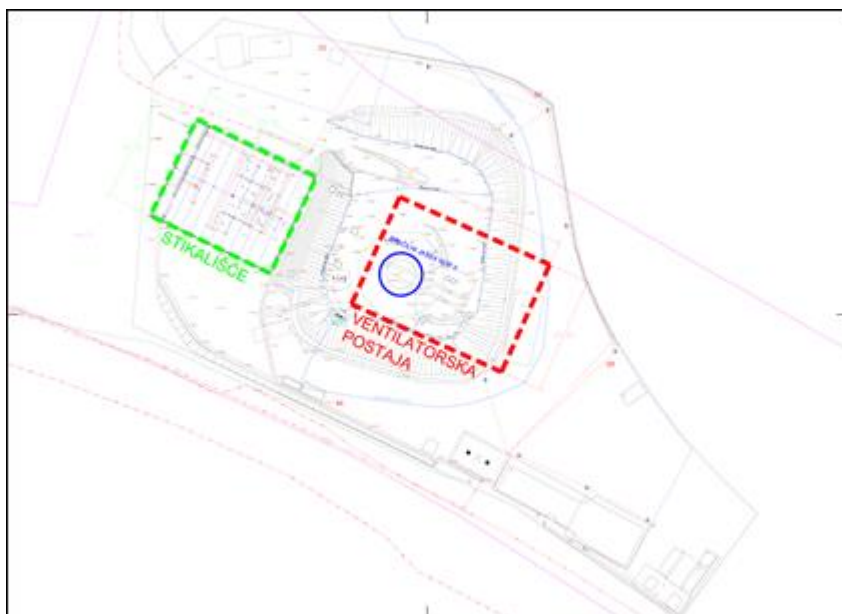
Slika 1: Situacija mesta postavitve ventilatorske postaje ter mesto stikališča VP NOP II

Na voljo je geodetski posnetek, dokumentacija pripravljalnih del, NOP II point cloud acad dokumentacija.