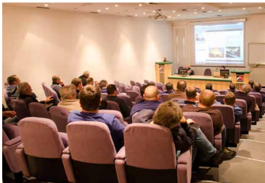
Udeleženci tečaja so oblikovali vprašanja, na katera so od zunanjih strokovnjakov dobili takojšnje odgovore

Čeprav je takšen način izobraževanja za nas nekaj novega, se je po odzivu udeležencev pokazal za dobro odločitev, saj je poleg tega, da je brezplačen, tudi interaktiven. To pomeni,