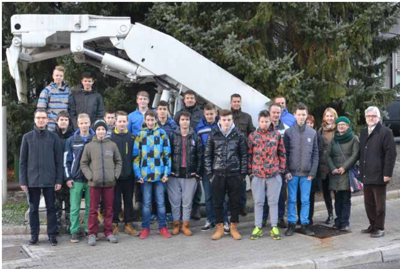
Dneva odprtih vrat v Premogovniku Velenje so se udeležili predvsem tisti devetošolci, ki so prepričani, da bodo za nadaljnje izobraževanje izbrali enega od rudarskih poklicev.

V petek, 11. decembra 2015, smo v Premogovniku Velenje v sodelovanju s Šolo za rudarstvo in varstvo okolja Šolskega centra Velenje pripravili dan odprtih vrat, da so lahko devetošolci dobili dodatne informacije pred odločitvijo za poklicno pot. Dneva odprtih vrat so se udeležili tisti, ki jih rudarski poklici zanimajo.