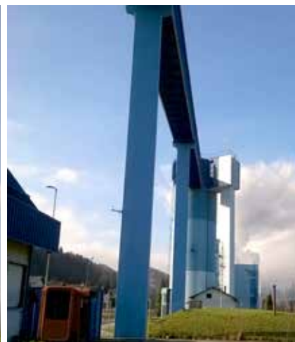
Pogled na najvišja stebra z vidnimi poškodbami konstrukcije in videz po sanaciji