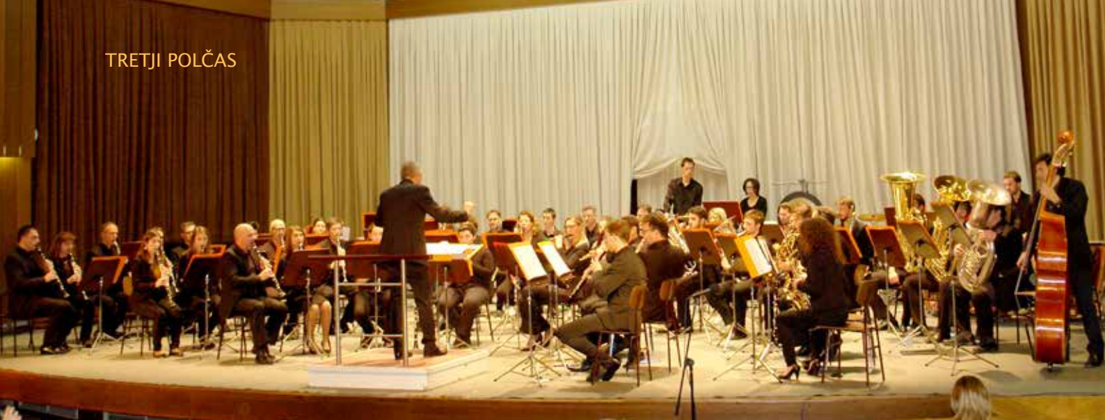
Na prvem abonmajskem koncertu velenjskih godbenikov je bil z nami Pihalni orkester Orchestra di Fiati »Val Isonzo«.