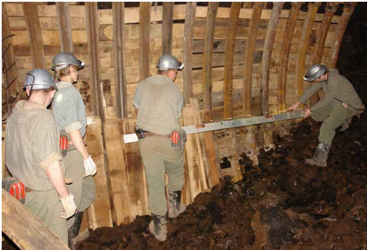
Dijaki, ki se odločijo za poklic geostrojniki rudar, se poleg šolske teorije tri leta praktično izobražujejo v jami Premogovnika Velenje.

Nadaljujemo s predstavitvijo rudarskih poklicev, ki smo jo začeli v novembrski številki Rudarja.