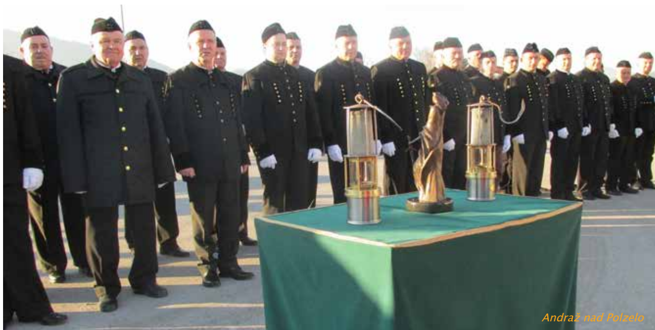
Andraž nad Polzelo

4. decembra, ko praznujemo god sv. Barbare – zavetnice rudarjev, so tudi letos prizadevni organizatorji v bližnjih krajih Andražu nad Polzelo, Ponikvi pri Žalcu in Vinski Gori pripravili svečanosti. Ob tem za rudarje zelo pomembnem prazniku so se v Andražu zbrali v soboto, 5. decembra, v drugih krajih pa dan kasneje.