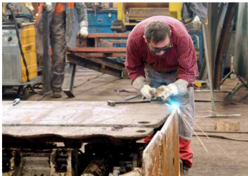
V Strojnem remontu popravljajo in obnavljajo odkopno ter drugo opremo, ki je potrebna za nemoteno obratovanje Premogovnika Velenje.

terjev, remont vozni enot pa poteka konstantno skozi celo leto. Opravili smo remonte transportnih vitlov, reduktorjev za vse verižne in tračne transporterje, vrtnih garnitur in vrtnega pribora, tračnih transporterjev. Med drugim smo izvedli popravilo in obnovo pogonskih bobnov, visečega in talnega tira, VDL-opreme, popravilo in kompletiranje energetskih vlakov, remont hidrodinamičnih sklopov, pnevmatskih strojčkov in dvigovalnikov, remont ročnih poteznikov, predelavo in preizkus hidravličnih cevi, remonte hidravličnih cilindrov in stojk, hidravličnih ventilov in komand, vodnih in centrifugalnih črpalk ter remont opreme za zapolnjevanje in opreme Hauhinco. Vso navedeno opremo remontiramo hkrati z remontu opreme za odkope.