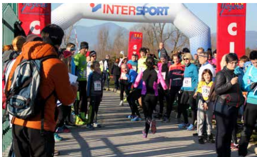
Predaja štafete

Najmlajša ekipa Mladi upi je štela 26 let (najmlajša sta bila 6-letnika Živa