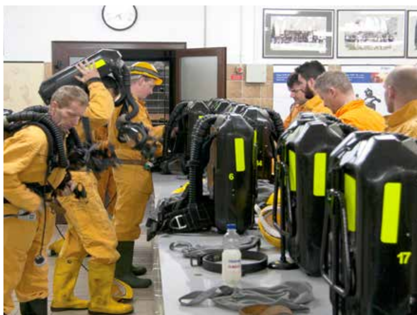
Jamska reševalna četa Premogovnika Velenje danes šteje 107 najbolj usposobljenih rudarjev in drugih zaposlenih v Skupini Premogovnik Velenje.