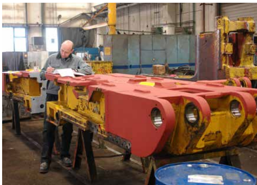
Tehnični pregled ustreznosti obnovljene opreme