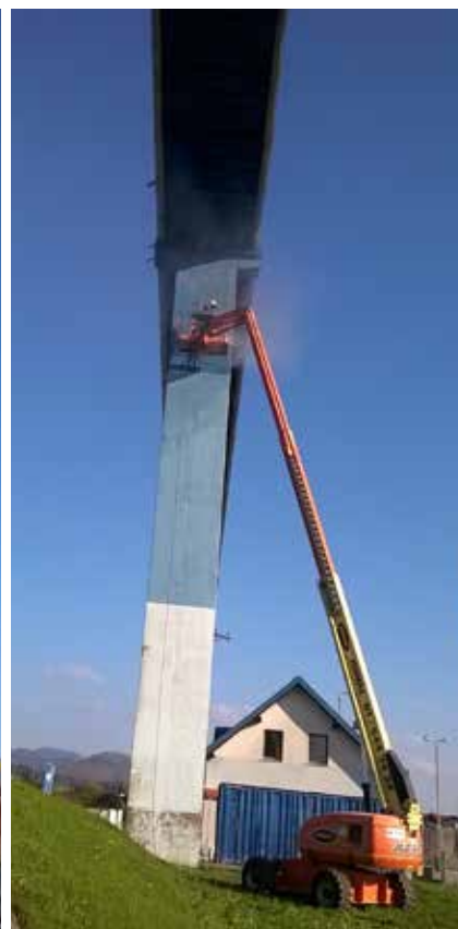
Sanacija je bila izvedena s pomočjo delovnih odrov in dvižnih košar.