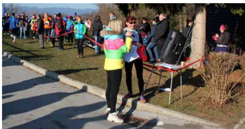
Pogovor s znano slovensko atletinjo Heleno Javornik