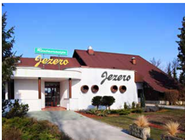
Restavracija Jezero v Velenju