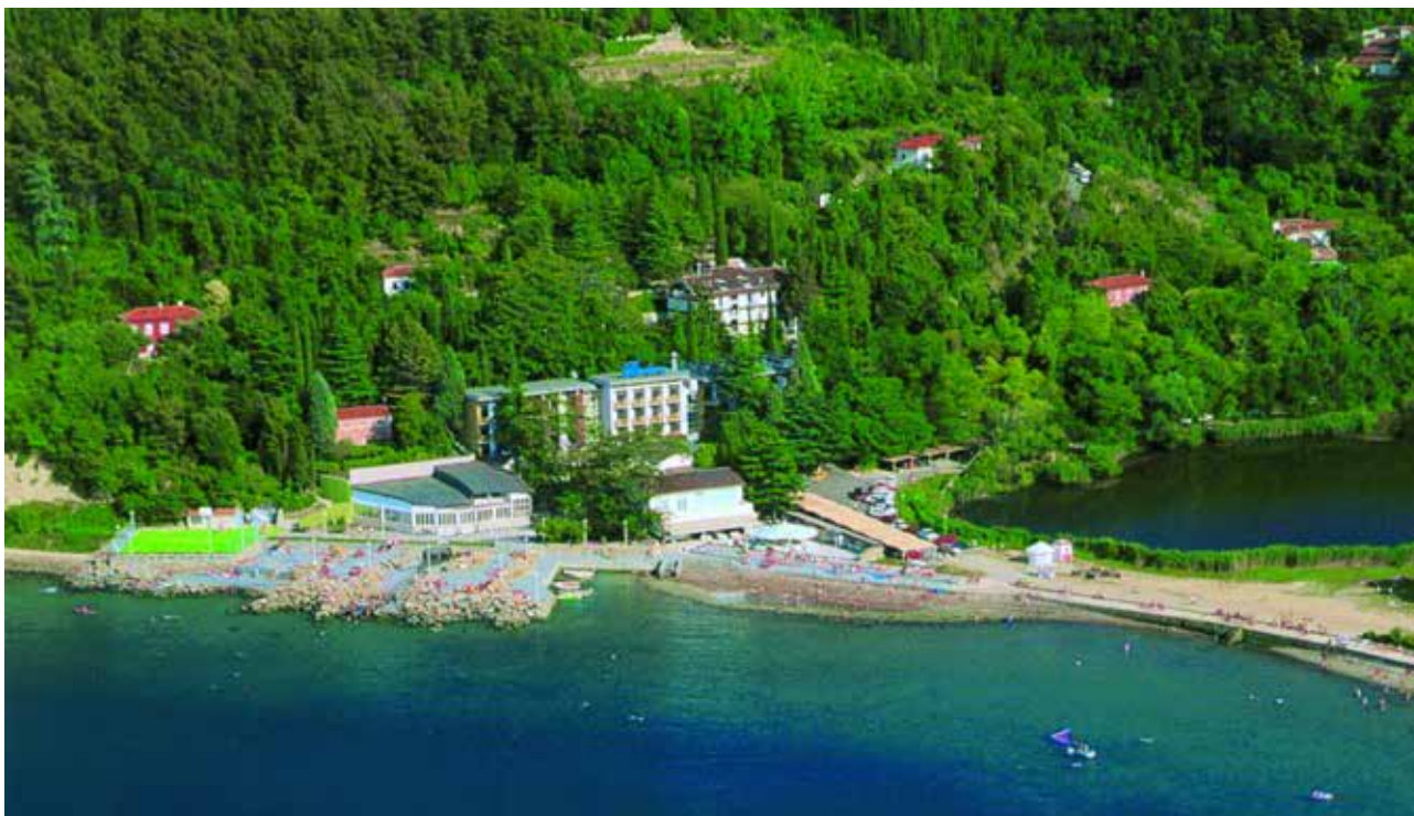
Hotel Barbara v Fiesi leži v najlepšem, najbolj zelenem in mirnem delu slovenske obale, v zalivu med Piranom in Strunjanom.

Premogovnik Velenje v okviru dezinvestiranja izvaja dejavnosti odprodaje poslovno nepotrebne premoženja v obliki nepremičnin. Mednje spadata tudi Hotel Barbara v Fiesi in Hotel Oleander v Strunjanu, za katera je bil v petek, 17. aprila 2015, v Uradnem listu Republike Slovenije, na spletni strani družbe in na različnih mednarodnih portalih objavljen javni razpis zbiranja ponudb.