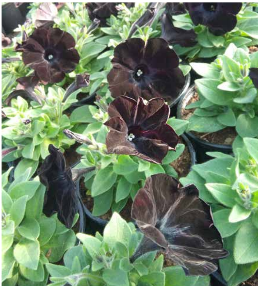
Letošnja posebnost – črne petunije

Tudi na teh površinah skrbimo za grmovnice, žive meje, cvetlične grede, urejamo aranžmaje v avli upravne zgradbe NOP in travne površine okoli zgradb, škropimo plevel na industrijskih površinah in tudi okrasimo marsikatero prireditve v sklopu podjetja. Med največjimi so prireditve ob prazniku rudarjev in tudi nageljni, ki krasijo praznične črne uniforme, so del naše skrbi.