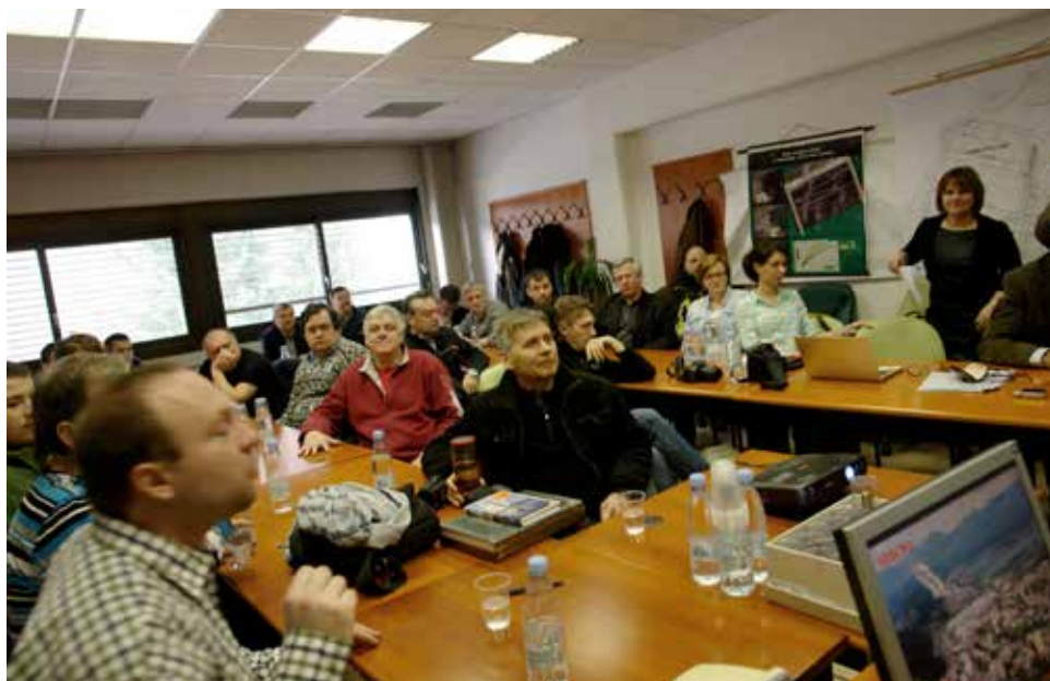
Premogovnik Velenje je obiskalo 25 udeležencev, med njimi 19 odraslih in 6 dijakov rudarske šole.

Ogled je vključeval približno 2 km dolg sprehod od vhoda na Lero do centra za obiskovalce in nazaj. Na poti je vodnik predstavil Krajinski park Sečoveljske soline – rastlinstvo, živalstvo, kulturno dediščino. V središču za obiskovalce smo si ogledali krajši film ter predstavitev vodnega sistema z interaktivno maketo solin.