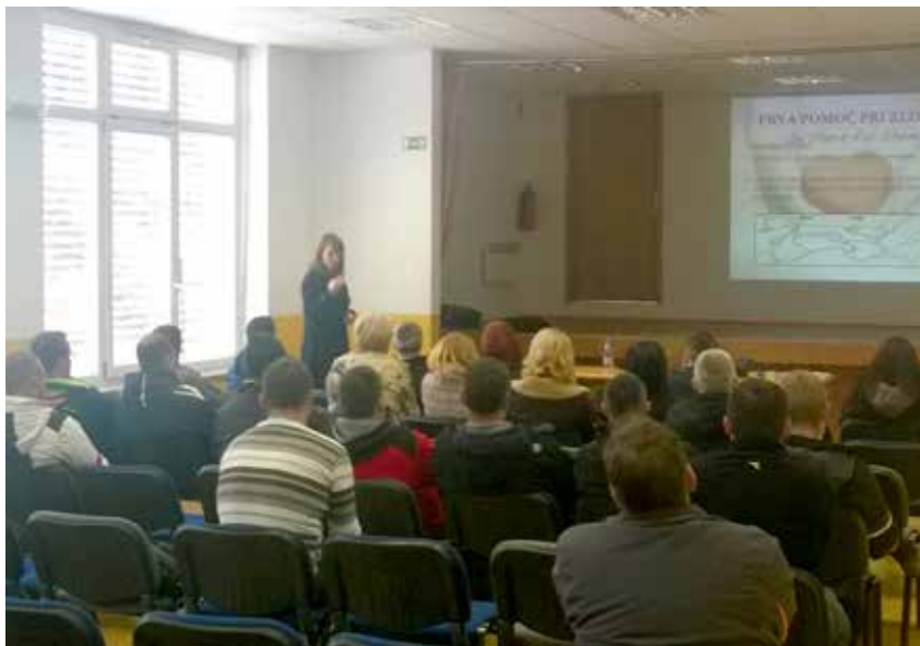
Utrinek s predavanja. Izobraževanja se je udeležilo skoraj 95 % vseh zaposlenih v družbi RGP.

Ker živimo v zelo stresnem obdobju, smo se zaposleni seznanili tudi s stresom na delovnem mestu in depresijo. V obdobju zadnjih desetih let sta med aktivnim prebivalstvom v velikem porastu.