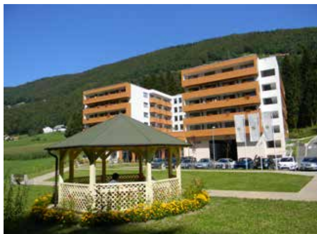
Center starejših Zimzelen v Topolšici

Predmet nadaljnega dezinvestiranja bodo še Center starejših Zimzelen, Vila Široko z zemljišči, Restavracija Jezero, Bela dvorana, Upravna zgradba Gost, Steklena direkcija, poslovni prostor Šmarno ob Paki ter zemljišča.