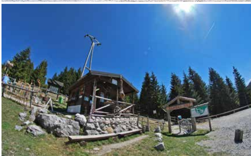
Golte tudi poleti ponujajo številne možnosti preživljanja prostega časa v naravi.

nudbe dejavnosti želimo na planino privabiti nove obiskovalce, ki iščejo kakovostno možnost preživljanja prostega časa v naravnem okolju. V sodelovanju s ponudniki turističnih storitev v Savinjski in Šeleški dolini