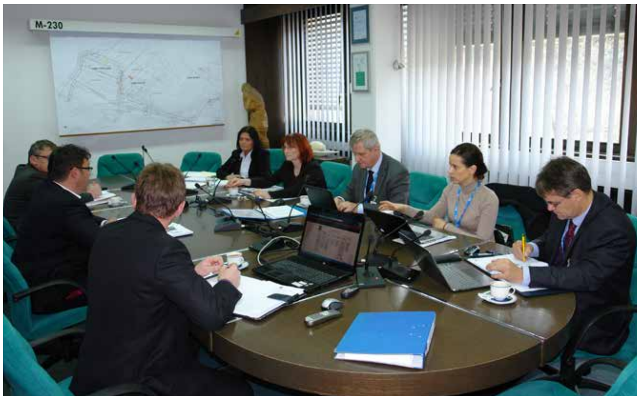
Zunanjo presojo sistemov vodenja pri nas izvajajo sodelavci Slovenskega instituta za kakovost in meroslovje (SIQ).

V Premogovniku Velenje in HTZ Velenje imamo certificirane tri sisteme vodenja. Sistem vodenja kakovosti po standardu ISO 9001:2008, sistem ravnanja z okoljem po standardu ISO 14001:2004 ter sistem varnosti in zdravja pri delu po standardu BS OHSAS 18001:2007. Vpeljan imamo tudi sistem upravljanja z energijo po standardu ISO 50001:2011, vendar smo obnavljanje certifikata za ta standard letos opustili.