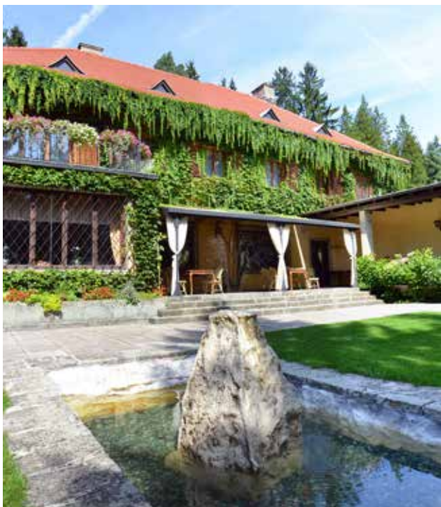
Vila Široko v Šoštanj