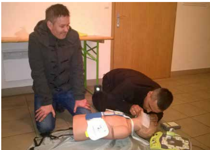
V praktičnem delu smo vsi zaposleni izvedli oživljanje ponesrečenca z uporabo defibrilatorja.

Ne glede na to kdaj smo začeli aktivno delati in koliko let imamo delovne dobe, je nujno potrebno stalno dodatno izobraževanje. Zaposleni