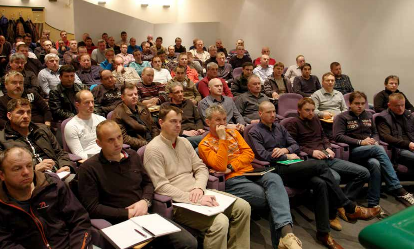
Letošnjega izobraževanja nadzorno-tehničnega osebja se je udeležilo 17 poslovodij in 216 nadzornikov, od tega je bilo 110 rudarskih, 52 strojnih in 52 elektronadzornikov.