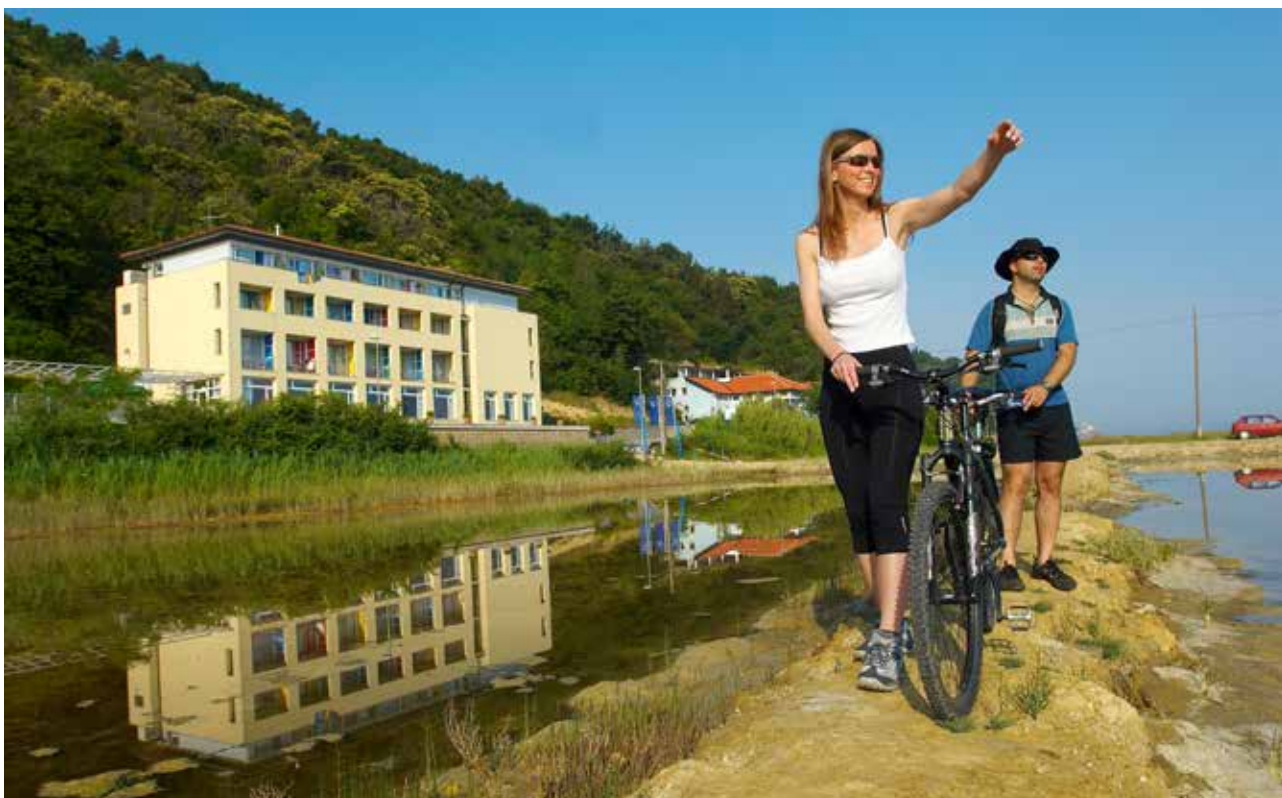
Hotel Oleander je manjši sodobno opremljen hotel ob slovenski obali in se nahaja sredi mirnega okolja Strunjanskih solin med Izolo in Piranom.

Predmet nadaljnega dezinvestiranja bodo še Center starejših Zimzelen, Vila Široko z zemljišči, Restavracija Jezero, Bela dvorana, Upravna zgradba Gost, Steklena direkcija, poslovni prostor Šmarno ob Paki ter zemljišča.