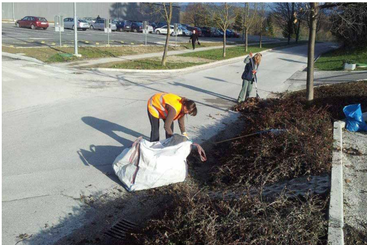
Vsako pomlad je veliko dela s čiščenjem in obrezovanjem grmičevja.

Septembra 2010 je Mestna občina Velenje podpisala desetletno koncesijsko pogodbo za opravljanje lokalne gospodarske javne službe urejanja in čiščenja javnih površin s podjetjem Andrejč, nizke gradnje, urejanje okolja, d. o. o. Koncesijska pogodba zajema urejanje in vzdrževanje utrjenih javnih površin, pometanje in čiščenje le-teh, urejanje in čiščenje zelenih javnih površin, vzdrževanje urbane opreme, vodomotov, igral in izobešanje zastav.