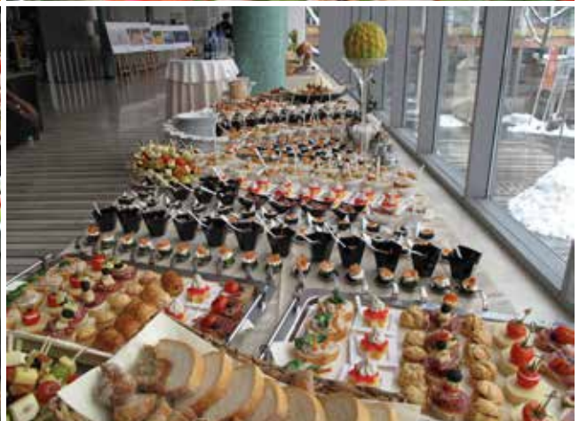
Osebjje podjetja Gost se vselej potrudi, da nas razvaja.

Podjetje Gost med drugim skrbi tudi za organizirano prehrano zaposlenih in študentov. Njegovi zaposleni dnevno pripravijo več kot 3.000 obrokov za več podjetij. Bogato kulinarčno ponudbo si lahko privoščite v vseh njihovih hotelih, restavracijah in okrepčevalnicah. Več o ponudbi Gosta na www.gost.si ali na 03 896 43 00.