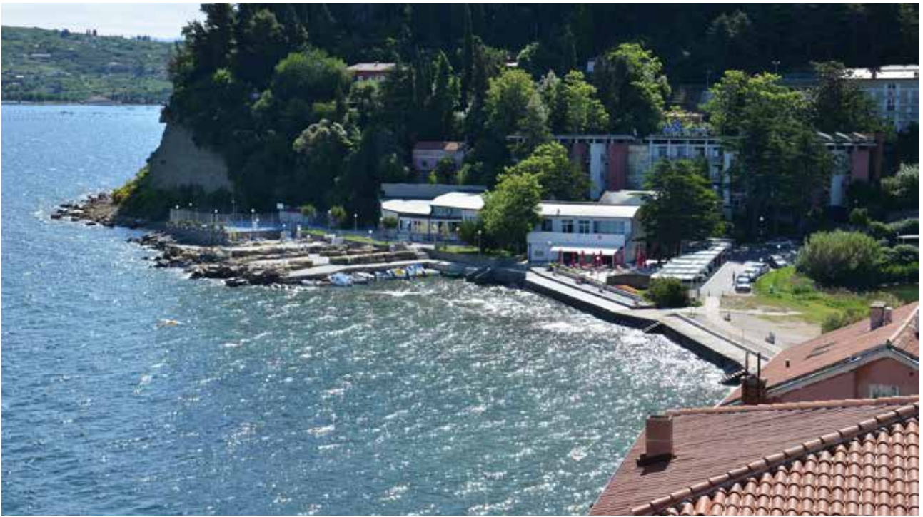
Hotel Barbara v Fiesi in Hotel Oleander v Strunjanu vabita na oddih v čudoviti naravi slovenske obale.