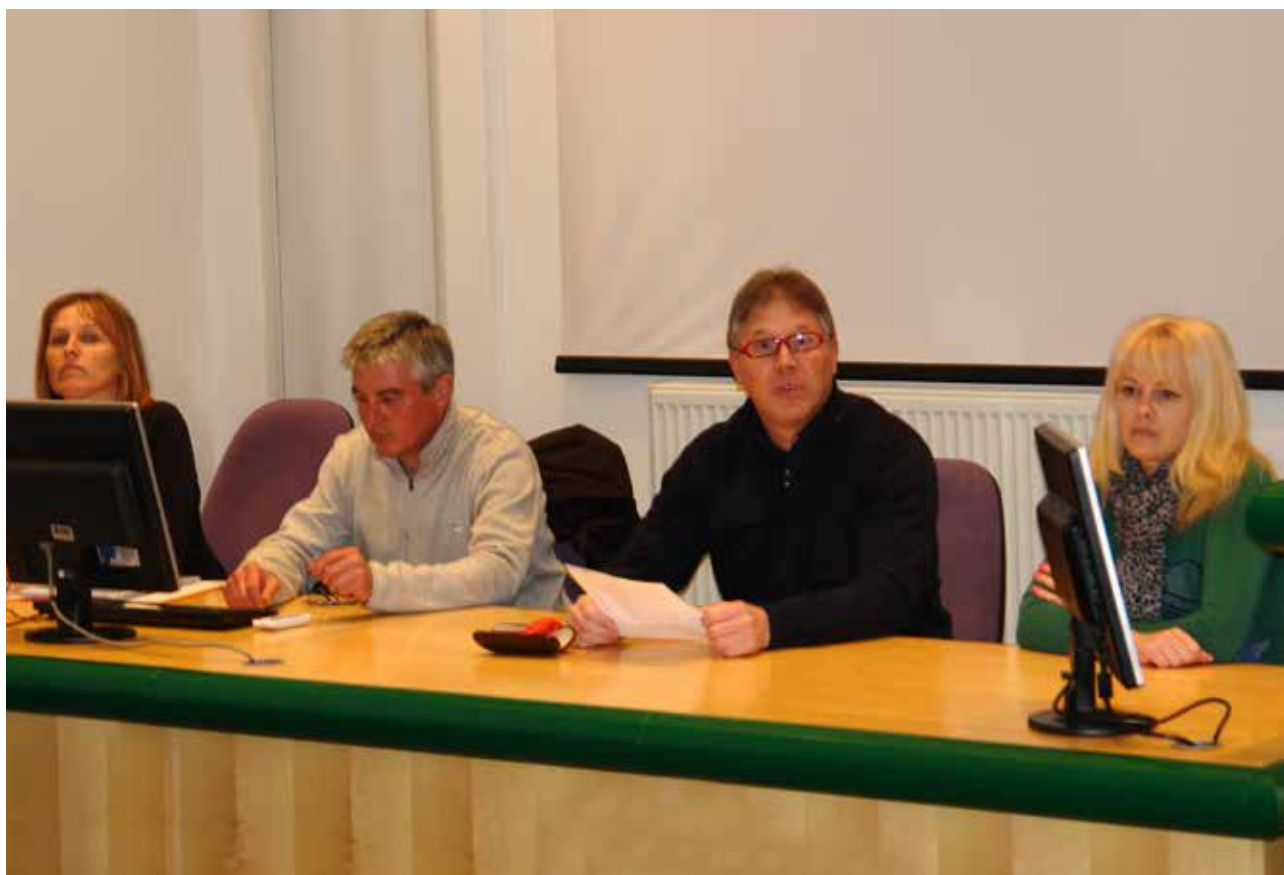
Zbor članov Aktiva delovnih invalidov Skupine PV je bil izveden pod budnim očesom delovne komisije.

Aktiv delovnih invalidov Skupine Premogovnik Velenje je v sredo, 25. februarja 2015, v Zeleni dvorani upravne zgradbe NOP pripravil zbor svojih članov. Številna udeležba članic in članov je dokaz, da je Aktiv ves čas vpet v delo in dogajanje v kolektivu.