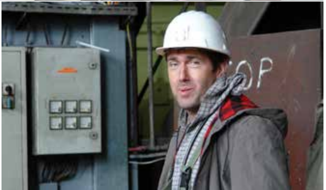
Veseli ob koncu »ših«