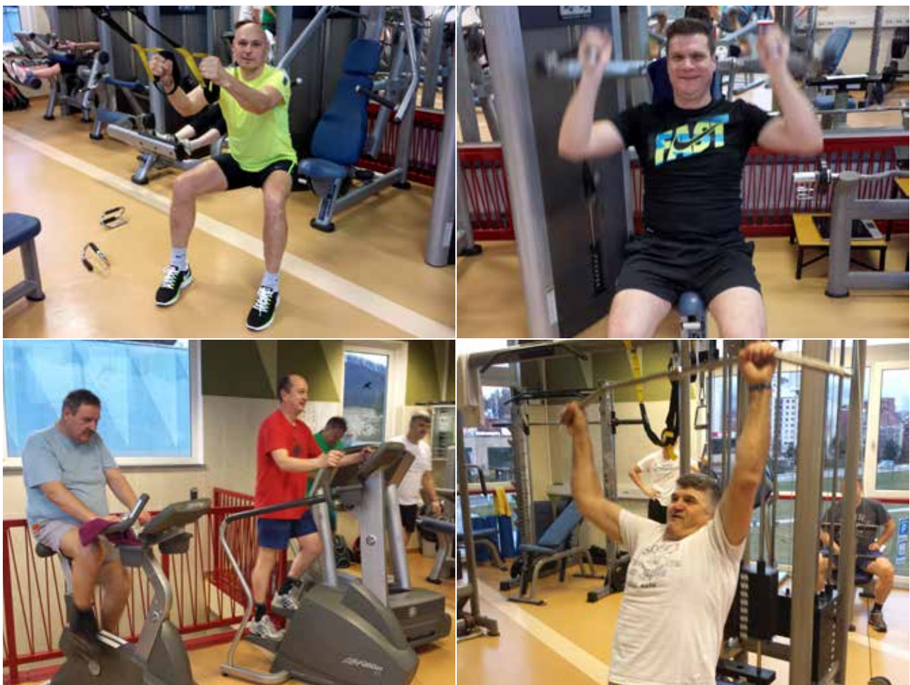
»Za fit postavo je treba trdno garati (zimsko prevetiva).«