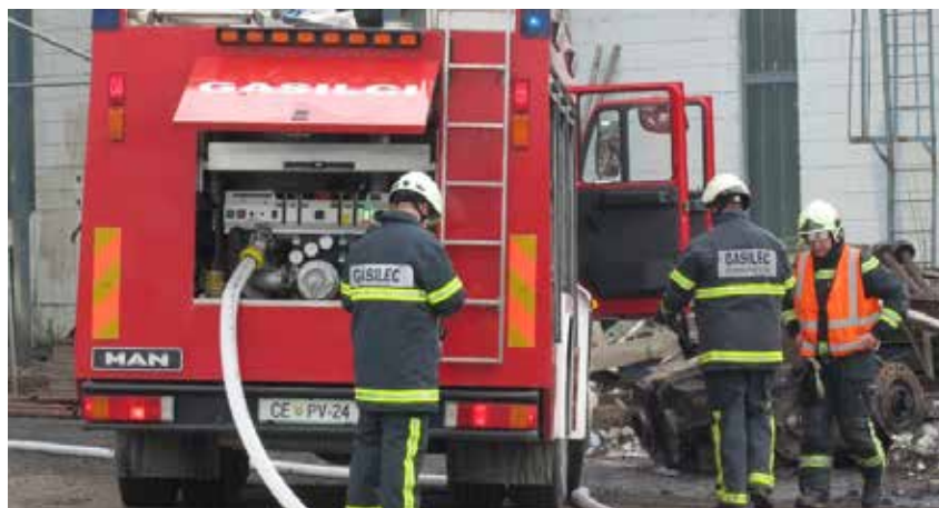
Odziv članov Prostovoljnega industrijskega gasilskega društva Premogovnika Velenje na nenapovedano vajo je bil dober.

Na prizorišče požara so z vozilom prvi prispeli gasilci PGD Velenje, takoj za njimi pa vozilo našega društva s šestimi gasilci. Velenjsko društvo je zaradi potrebe po večji količini vode na pomoč poklicalo PGD Vinska Gora. Na klic se je odzvalo še šest članov našega društva, štirje od teh so zaradi razširitve požara izvozili še z enim vozilom, dva sta počakala v gasilskem domu.