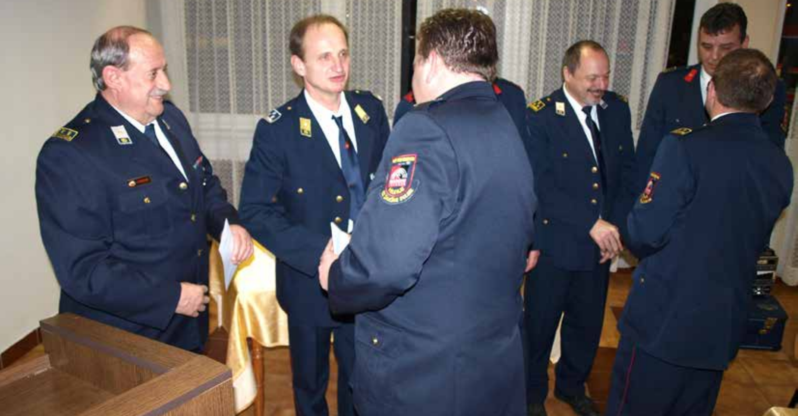
Posamezniki, ki izžarevajo še posebno željo po skupnem delu, so pomemben del mozaika, zato jim na občnem zboru za njihovo delo, zanos in prizadevnost izkažejo pozornost.