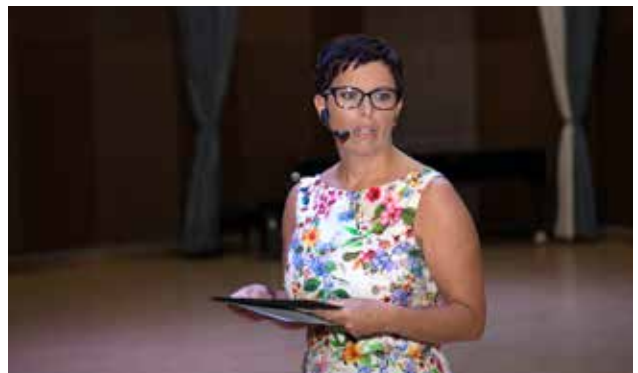
Koncentracija pred prihodom na oder je zelo pomembna!