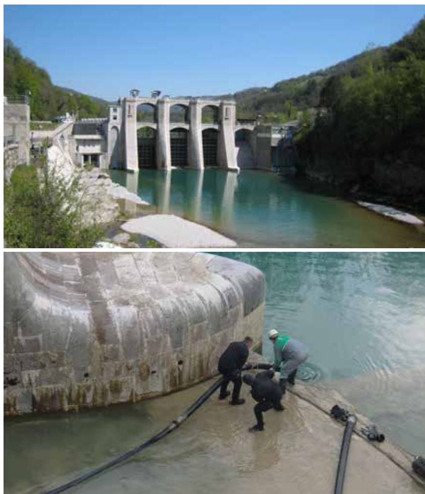
RGP izvaja zahtevno sanacijo podvodnih poškodb na prelivnih poljih vodne pregrade Ajba na reki Soči.

Na lokacijah, kjer so bile fuge med kamnitimi bloki in betonom sprane, preperle in razrušene, smo z uporabo