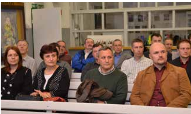
Globoko zamišljeni ...