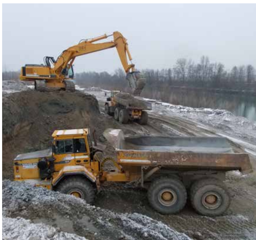
Osnovna naloga je sanacija obeh prebojev ter izgradnja visokovodnega nasipa, ki bo zagotavljal, da v prihodnje ne bo več prihajalo do prelivanja ter vnašanja materiala v ta odvodni kanal.

Delo poteka v dveh fazah. Tehnologija prve faze obsega izkope s klasičnimi bagri, prevoz materiala s kamioni in z demperji, razstiranje materiala z buldožerji ter izdelavo nasipov z utrjevanjem s pomočjo valjarjev. Pri izvedbi nasipov je treba