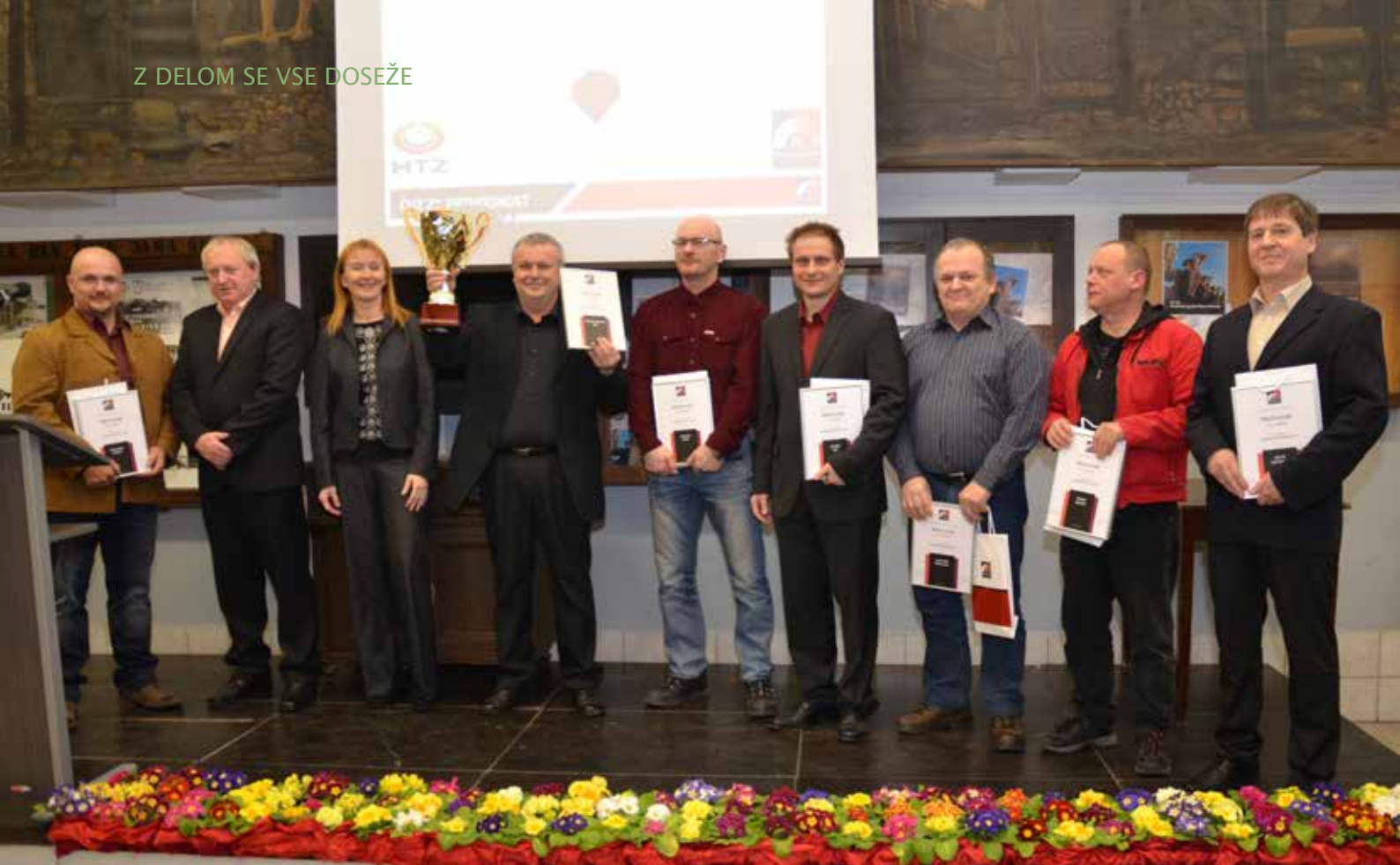
Najboljši inovatorji in promotorji inovacijske dejavnosti v Premogovniku Velenje in HTZ Velenje v letu 2014