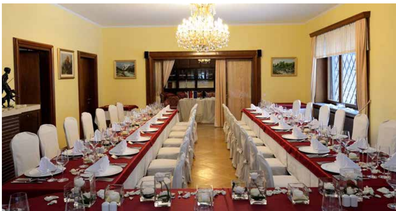
Dvorna restavracija Vila Široko vam v čudovitem ambientu nudi številne možnosti za proslavitev posebnih dogodkov.