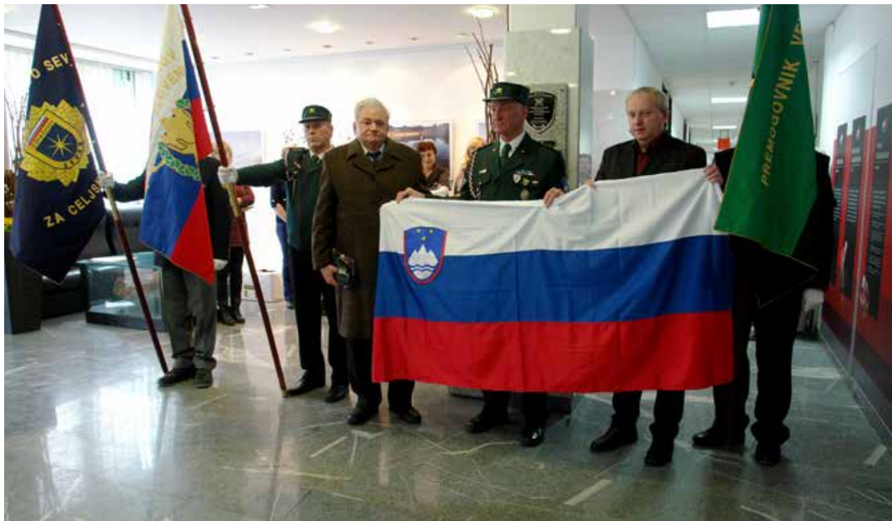
Slovenska osamosvojitvena zgodovina se je med drugim pisala tudi v Premogovniku Velenje

V Premogovniku Velenje smo se v torek, 10. februarja 2015, s postavitvijo spominske plošče poklonili vsem, ki so bili pred skoraj 25 leti s pogumnimi in domoljubnimi dejanji zaslužni za to, da imamo danes svojo lastno in neodvisno državo. Slovenska osamosvojitvena zgodovina se je med drugim pisala tudi pri nas, saj smo na začetku devetdesetih let minulega stoletja del orožja in druge opreme takratne Teritorialne obrambe Slovenije skrili v prostorih našega premogovnika. S tem smo preprečili, da bi to prišlo v roke takratne Jugoslovanske ljudske armade.