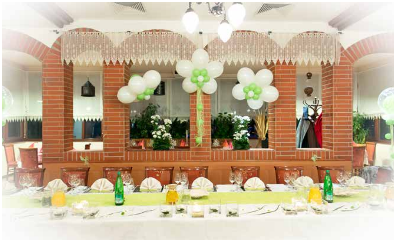
V Restavraciji Jezero v Velenju vam poleg bogate kulinarčne ponudbe postržejo tudi s sladicami iz svoje slaščičarne.

Gost je podjetje z dolgoletno gostinsko tradicijo, ki jo bogati z novimi idejami v ponudbi. O večletnem obstoju podjetja govori letnica njegove ustanovitve - 1991. Osnovni dejavnostima - gostinstvu in turizmu - se pridružuje še prireditvena dejavnost. Pri vseh dejavnostih pa se zaposleni trudijo združevati tradicijo in moderne pristope. Njihove prednosti so bogate izkušnje in strokovnost. Obiščite jih v Restavraciji Jezero, Bistrotu Arkada in Gostilnici Pri Knapu v Velenju, Vili Široko v Šoštanju ter Hotelu Barbara v Fiesi in Hotelu Olender v Strunjanu in se sami prepričajte!